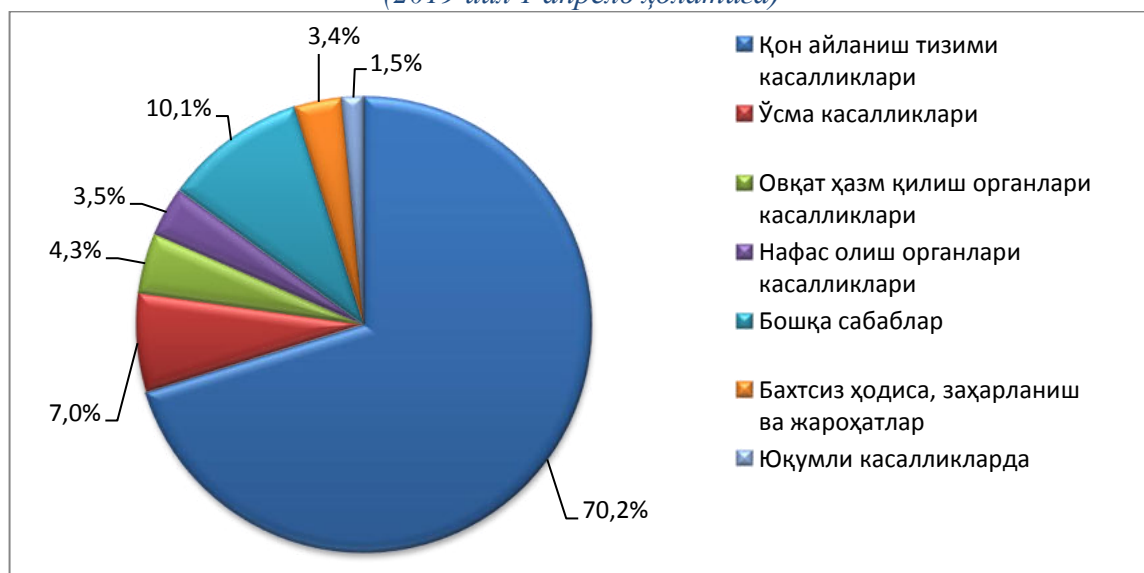
Ўлганлар умумий сонининг таркибий тузилиши (2019 йил 1 апрель ҳолатига)

Дастлабки маълумотларга кўра, 2019 йилнинг январь–март ҳолатига 1 та оналар ўлими рўйхатга олинган, бир ёшгача 195 та болалар ўлими қайд этилган. Гўдаклар ўлими коэффициентини 10,9 промиллени (2018 йил январь–мартда 14,8 промилле бўлган) ташкил қилди.