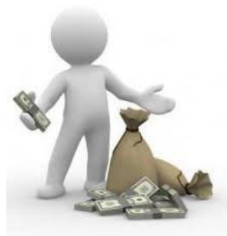
Andijon viloyati Demografiya va mehnat statistikasi boshqarmasi