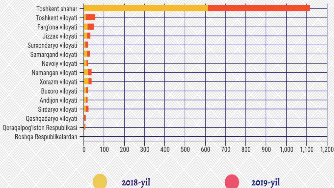
Qoraqalpog'iston Respublikasi va viloyatlar

Davlat statistika qo'mitasiga asosiy qismi Toshkent shahridan 504 ta (o'tgan yilning shu davrida 615 ta) murojaatlarni tashkil etgan. Shuningdek, Toshkent viloyatidan 45 ta, Farg'ona viloyatidan 31 ta, Jizzax viloyatidan 17 ta, Namangan viloyatidan 17 ta, Samarqand viloyatidan 15 ta, Surxondaryo viloyatidan 12 ta, Xorazm viloyatidan 14 ta, Sirdaryo viloyatidan 14 ta, Qashqadaryo viloyatidan 12 ta, Navoiy viloyatidan 6 ta, Andijon viloyatidan 6 ta, Buxoro viloyatidan 8 ta, Qoraqalpog'iston Respublikasidan 4 ta, va boshqa Respublikalardan 1 ta murojaatlar kelib tushgan.